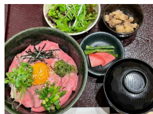
Roast Beef Bowl Lunch