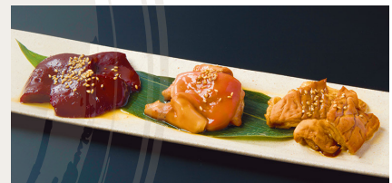
Today's 3 Kinds of Assorted