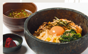
Stone Grilled Bibimbap