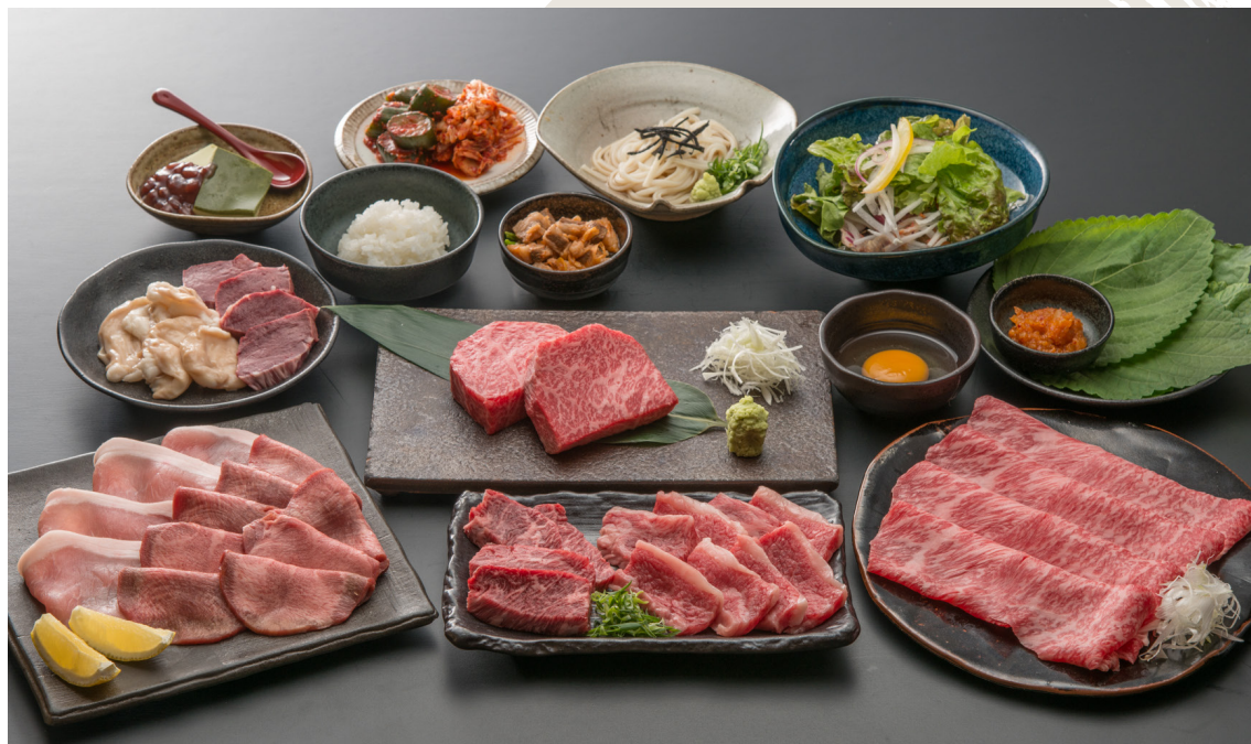
This Picture shows 'Deluxe Course' for 4 People.

* Course menus are up to stock availability