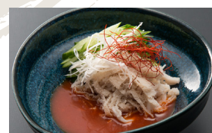
Beef White Omasum Sashimi