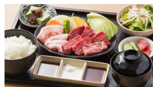
This picture is image of 'Lunch A'