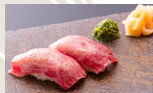
Premium Wagyu Sushi