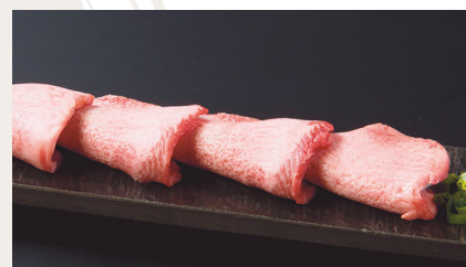
Wagyu Tongue With Salt

• Tongue with Salt and Green Onions / 上葱タン塩焼き 1,850JPY tongue is from NewZealand or USA