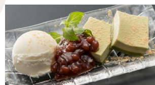
Matcha Milk Pudding