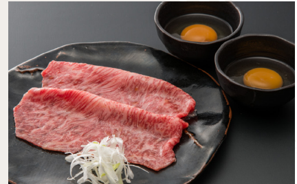
Grilled Sirloin Sukiyaki This picture shows 2 slice of sirloin