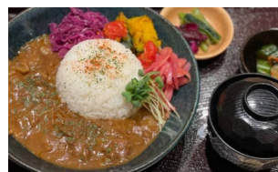
Curry and Rice with Beef Tendon