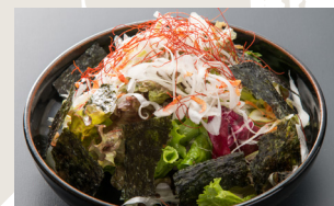
Scallion and Seaweed Salad with Special Dressing