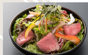
Mixed Green Salada with Roast Beef